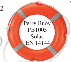
Perry Buoy PB1005 Solas EN 14144